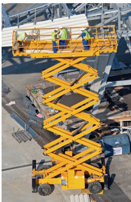
Piattaforma di lavoro con snodi a forbice

Supporti in uno snodo a forbice con boccola a strisciamento KS Permaglide® della forma costruttiva PAP ... P200