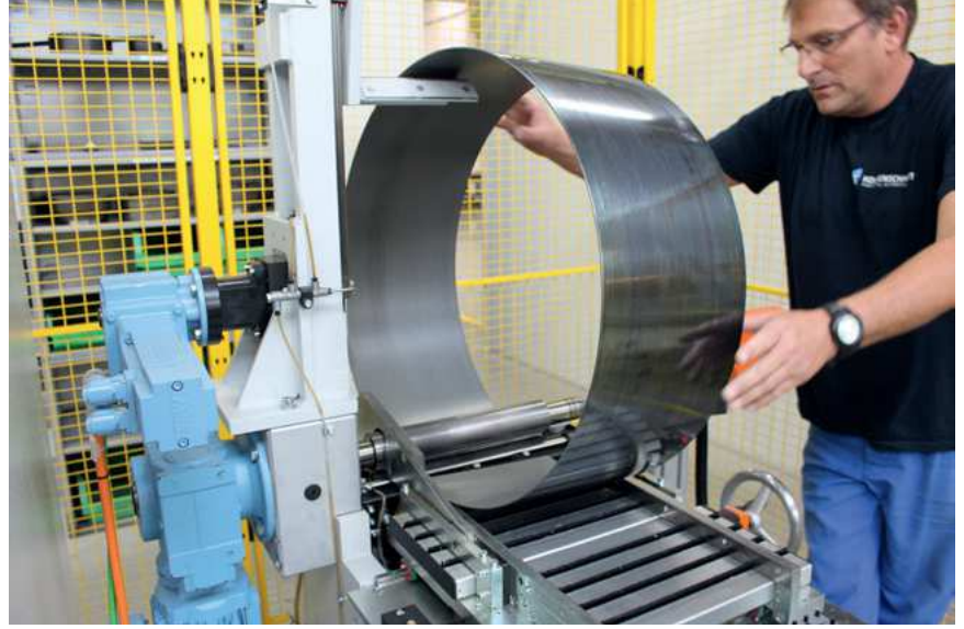
Kaymalı yatak üretimi

KS PERMAGLIDE® malzemelerden üretilen sac levhalar işlenerek özel çap değerlerine sahip burçlara veya az yer kaplayan ince duvarlı büyük burçlara dönüştürülür. Sac levha kesitleri, merdaneli bükme sistemlerinde şekillendirilerek kaymalı yatak burçları haline getirilir. KS PERMAGLIDE® sac levhaların nominal duvar kalınlığı genellikle 2,5 mm'dir ve üretime bağlı olarak 1 ile 3 mm arasında olabilir. Sacların genişliği 236 mm'ye kadar çıkabilir. Cilalanmış saclar bobin ürünler olarak hazır edilir. Bu nedenle sacların uzunluğu ve saclardan şekillendirilen burçların çapları değişkendir. Üretim yöntemi nedeniyle, sarılı durumdaki burçlarda prensip olarak bir küt ek mevcuttur.